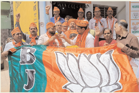
राजस्थान की राजनीति

शहर मंडल कार्यालय पर सामूहिक हनुमान चालीसा पाठ का आयोजन