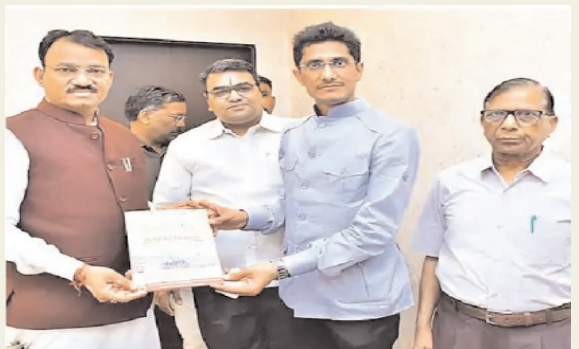
राजस्थान की राजनीति

जयपुर। जयपुरवासी गर्मी जनित रोग से बचाव व उपाय जान सकेंगे। राष्ट्रीय आयुर्वेद संस्थान में 11 अप्रैल से राष्ट्रीय आरोग्य मेले का शुभारंभ होने जा रहा है। चार दिन तक चलने वाले इस आरोग्य मेले में दुनिया भर के विशेषज्ञ व्याख्यान देंगे। भारत सरकार के आयुष मंत्रालय की ओर से प्रायोजित व अखिल भारतीय आयुर्वेद महासम्मेलन के तत्वावधान में राष्ट्रीय आरोग्य मेले का आयोजन किया जाएगा। मेले में मुख्य अतिथि उपमुख्यमंत्री व आयुष मंत्री प्रेमचंद बैरवा को आमंत्रित करने के लिए महासम्मेलन के प्रतिनिधि मंडल ने उनसे भेंट की। इस दौरान बैरवा ने कार्यक्रम विवरणिका का विमोचन भी किया।