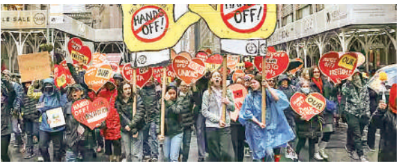
परिधि स्वकार से लेकर सिटी हॉल तक निकाली गई रैलियां

संयुक्त राज्य अमेरिका में शनिवार को विपक्षी आंदोलन का अब तक का सबसे बड़ा प्रदर्शन देखने को मिला। अमेरिका में हजारों की संख्या में गुस्साए लोगों की भीड़ ने राष्ट्रपति डोनाल्ड ट्रंप के देश के चलाने के तरीके और उनकी नीतियों के खिलाफ देशभर में विरोध प्रदर्शन किया। अमेरिका के 50 राज्यों में 1200 से ज्यादा स्थानों पर राष्ट्रपति डोनाल्ड ट्रंप और एलन मस्क की अमेरिका के लिए नीतियों के विरोध में तथाकथित 'हैट्स ऑफ' प्रदर्शन किया गया।