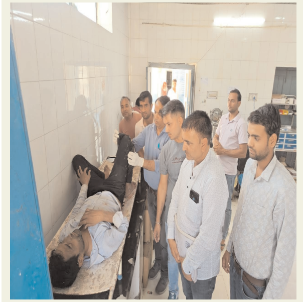
राजस्थान की राजनीति