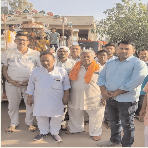
राजस्थान की राजनीति

रथ मेला कमेटी सदस्यों ने पूजा अर्चना कर निकाली श्रीराम की झांकी