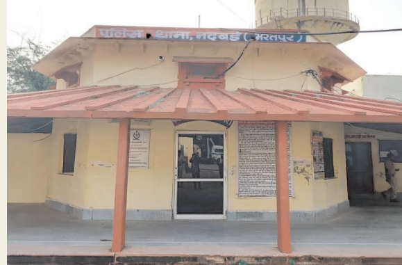
राजस्थान की राजनीति

नदबर्डी। थाना क्षेत्र से विशेष STC कोर्स में दाखिले के नाम पर तीन छात्रों से 2 लाख 18 हजार रूपए की ठगी करने का मामला सामने आया है। जहां पीड़ित ने रविवार को नदबर्डी थाने में एफआईआर दर्ज कराई है।