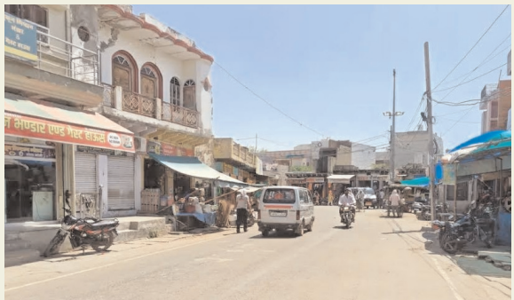
राजस्थान की राजनीति

नदबर्डी। रविवार को सूरज की तपिश और गर्म हवाओं ने लोगों को घरों में कैद होने पर मजबूर कर दिया। रविवार को दिन का अधिकतम तापमान 39 डिग्री सेल्सियस दर्ज किया गया। तेज धूप और गर्म हवाओं के चलते दोपहर 12 बजे के बाद से ही शहर के मुख्य बाजारों, चौराहों और सड़कों पर सन्नाटा पसर गया। आम दिनों में चहल-पहल से भरे रहने वाले बाजारों में इक्का-दुक्का लोग ही नजर आए। दुकानदारों ने बताया कि ग्राहकों की संख्या में भारी गिरावट आई है, जिससे व्यवसाय पर भी असर पड़ रहा है।