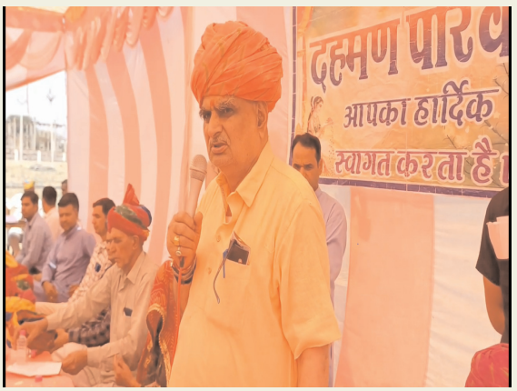
राजस्थान की राजनीति