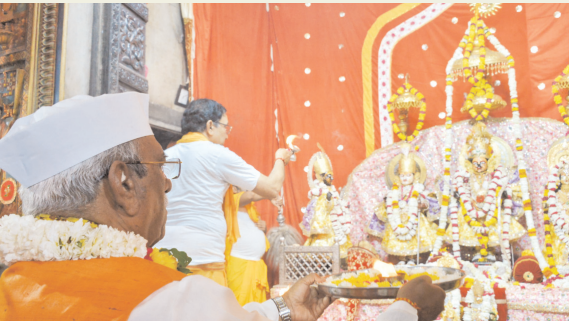
राजस्थान की राजनीति

रामनवमी पर राज्यपाल ने प्राचीन ठिकाना मंदिर श्रीरामचंद्रजी पहुंचकर महा आरती में भाग लिया, रामनवमी की सभी को शुभकामनाएं दी, विधिवत पूजा कर सबके मंगल की कामना की